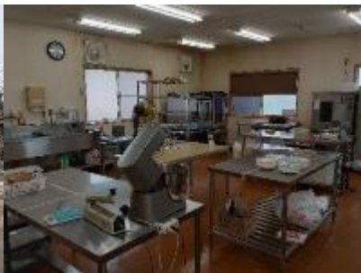
夢ポケット棟作業室