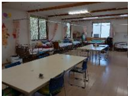
サンフラワー活動室