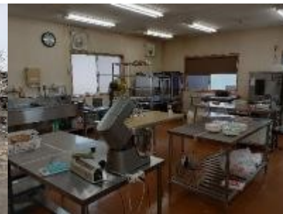
夢ポケット棟作業室