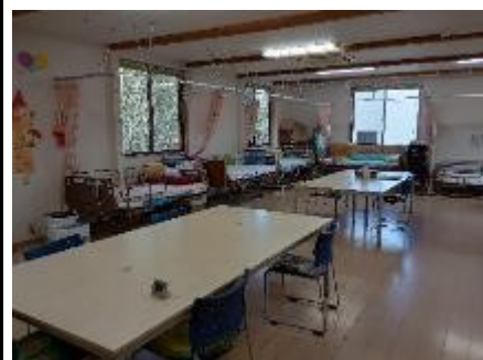
サンフラワー活動室