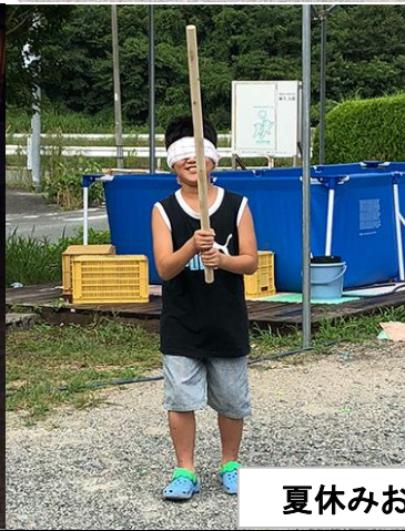
夏休みお泊まり会