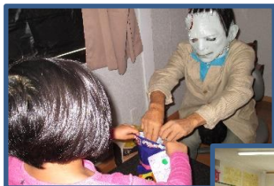
ハロウィンパーティー