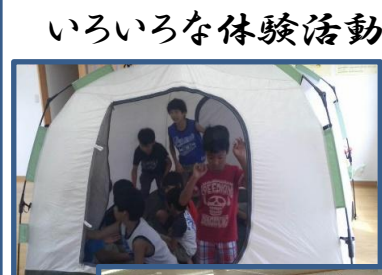
いろいろな体験活動