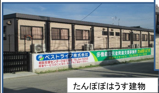
たんぽぽはうす建物