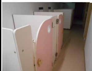
幼児用・児童用トイレ