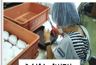
らくがんバリ切り