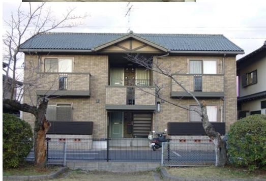
第2住居 シャンリバー知古 1階右下 102号室