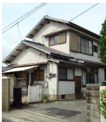
第1住居 なのはな荘外観 街並み 玄関