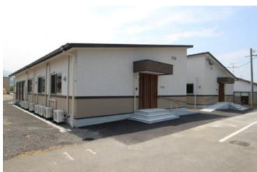
《 グループホームのぞみ外観 》