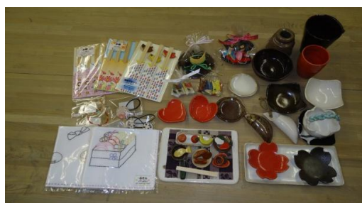
《 作品 》