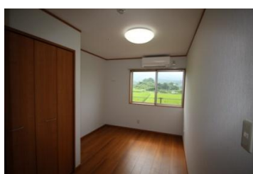
《 居室 》