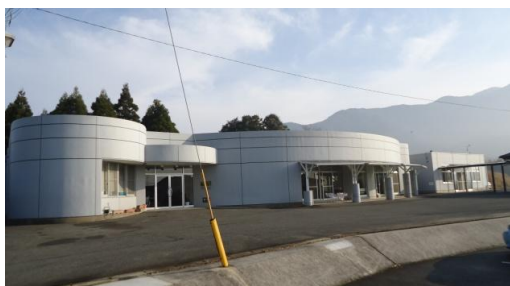
《 本館外観 》