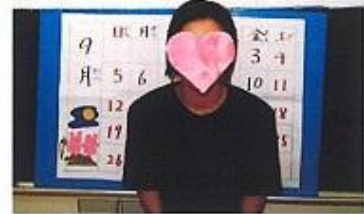
フォロー&サポートトークをして頂く先生

【日時】 2018年 9月2日（日） 午前10時～12時（途中休憩あり）※受付時間 午前9:30～9:50