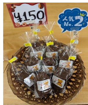
アーモンドスライスが入った 濃厚なココア味のクッキー