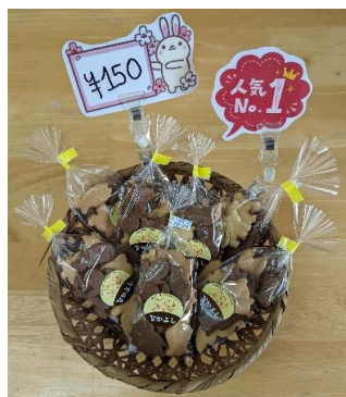
動物や乗り物の形をした プレーン&ココアクッキー