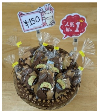
動物や乗り物の形をした プレーン&ココアクッキー