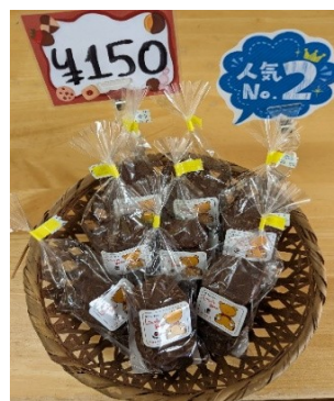
アーモンドスライスが入った 濃厚なココア味のクッキー